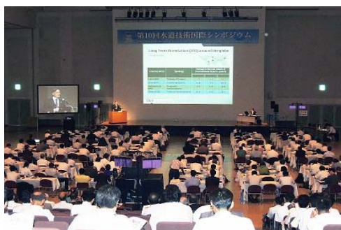
写真：講演会場 (第 10 回水道技術国際シンポジウム開催時)

シンポジウム（2019 年 7 月 9 日～10 日）のセッションの合間に貴社のプロモーション映像を上映いたします。なお、上映媒体は各社でご制作いただき、DVD もしくはデータ形式で納品してください。上映時間・上映回数等は、プログラムの詳細が確定後に決定予定です。