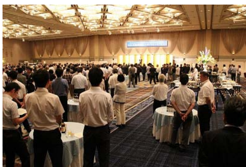
写真：レセプション会場 (第 9 回水道技術国際シンポジウム開催時)

シンポジウム参加者約 700 名が参加するレセプション、2019 年 7 月 9 日夜に横浜市内ホテルで開催。